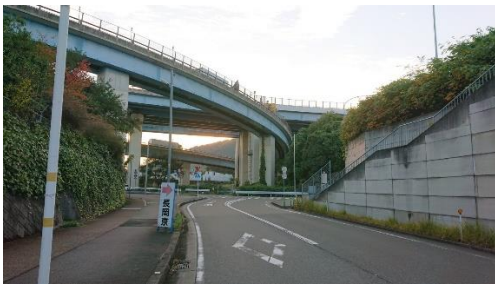
① 体育館前道路を南進、T字路を右折