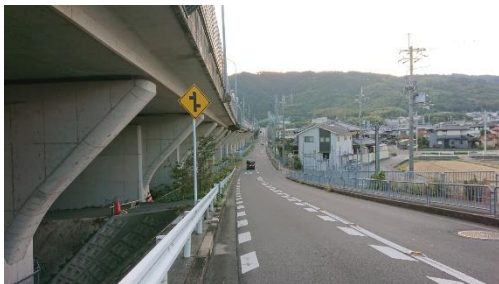
③名神に沿って南下