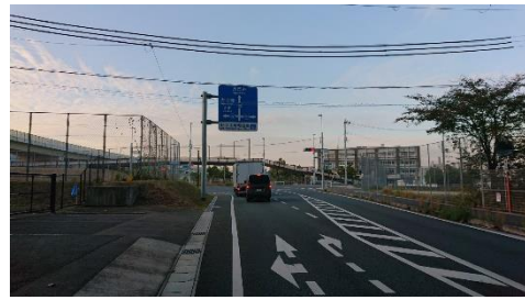
②名神をくぐり、信号を左折