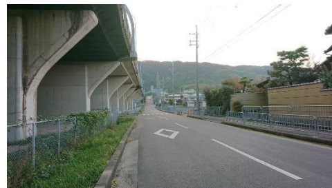
④信号手前のT字路を左折